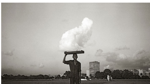
Charley Case, Oracle de rien. Le porteur de nuage , [s.d.], photographie contrecollée sur aluminium, 75 x 145 cm, Collection de l'artiste.

La référence d'une œuvre d'art trouve sa place dans la liste des figures, parfois à proximité de la reproduction dans le cas d'images insérées dans le texte.